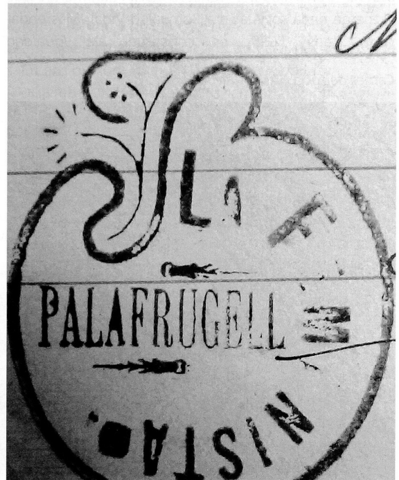
Segell de 'La Feminista'. (AMP - RM).

A Espanya, l'any 1822, es crea la Llei de Beneficència, l'any 1834 es van abolir els gremis i el 1839 es permetia la lliure associació de societats professionals enfocades a l'auxili mutu fet que, en alguna mesura, substituïa la caritat religiosa. L'any 1887 es va crear la Llei d'Associacions que va potenciar que a Espanya s'obrissin 663 societats d'aquests tipus i, l'any 1904, van arribar a haver-n'hi fins a 1.271. L'any 1900 s'implanta l'anomenada 'Llei Dato', que establia la responsabilitat dels empresaris a tenir cura dels accidents laborals dels seus obrers. Durant el regnat d'Alfons XIII, i propiciat per Antonio Maura, l'any 1908 es crea a l'Estat espanyol l' Instituto Nacional de Previsión (INP), Llei 27/02/1908. L'assistència va fer un nou canvi quan