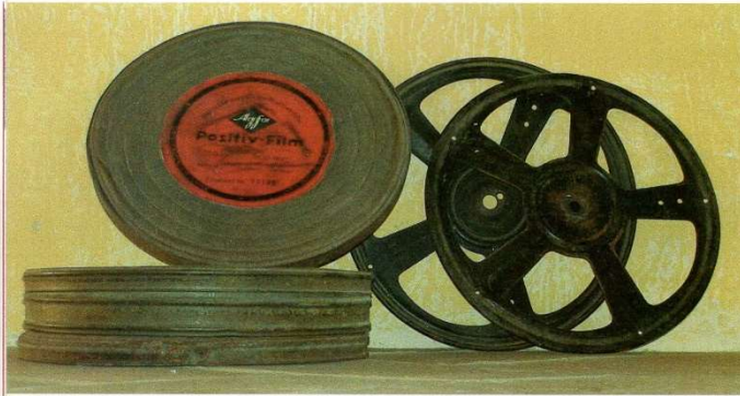
Llaunes on en Pere hi tenia guardades les seves filmacions. A baix, portada del DVD del reportatge fet per Antoni Martí, disponible a l'Arxiu Històric Comarcal del Baix Empordà a La Bisbal