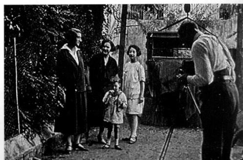
Pere amb la seva càmera

Al final dels anys 80 del segle XX i gràcies a la col·laboració d'uns laboratoris fotogràfics de la ciutat de Badalona es van poder reconvertir aquelles pel·lícules al format de vídeo VHS, el tipus de cintes