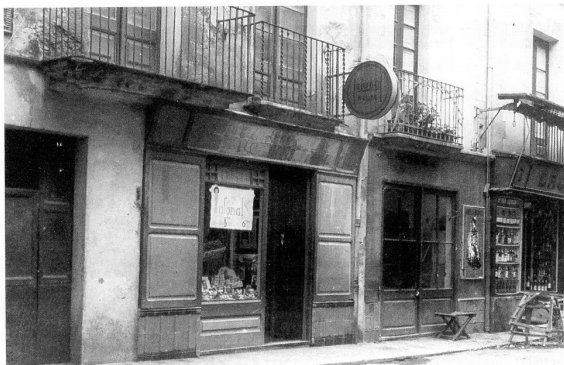
Façana de la vivenda i botiga del carrer Pi i Maragall, actualment carrer de la Riera. Al costat es pot observar part de l'adrogueria de Can Farreny.

una casa de roba i amb el que guanyava es pagava les classes al Conservatori de música, on hi va aprendre a tocar el violí. A la capital va viure els moments dels canvis socials, la Mancomunitat i la República, i es va implicar en diversos fets. Durant les hores de lleure tocava en un quartet musical que van crear un grup d'amics.