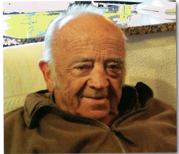
imatge Rosa M. Masana

Sí, tot que teníem aconducat al veterinari Massanes, perquè a més teníem set o vuit vaques i de tant en tant havia de venir. Aquí a Torrent totes les cases