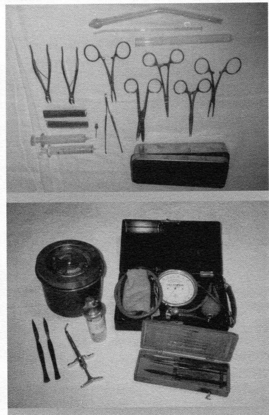
Instrumental quirúrgic utilitzat per llevadores i infermeres.