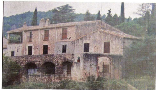
Mas Rostoll l'any 1950 aproximadament.

Després vaig anar a treballar al mas Rostoll, que en el seu temps era un dels masos més bonics de la Costa Brava. M'hi vaig estar 52 anys.