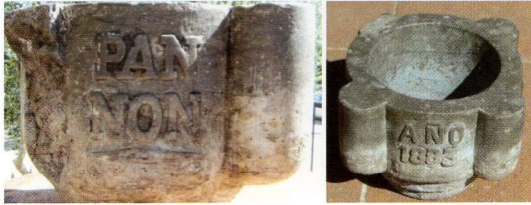
El morter fet per en Francisco Pannon. (Rosa M. Masana)

El meu pare era picapedrer i també cap de l'estació del Carrilet de Torrent. Mira, encara guardem aquesta fotografia i també aquest morter que va fer ell.