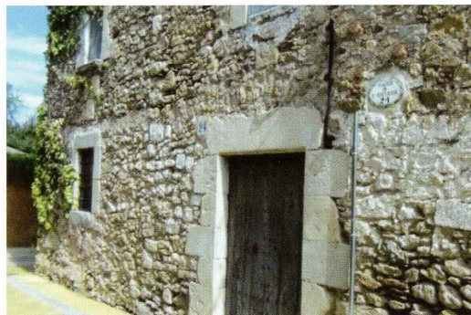
Can Boxiner a l'actualitat, que és segona residència

El Narcís era el gran i no va estar de sort a la vida perquè va haver de marxar a fer el servei militar no trobant-se bé, tenia febre i va estar quatre anys rondant-la de un costat a l'altre fins que va tornar a casa molt dèbil. Nosaltres vàrem fer els possibles per tirar-lo endavant però en aquell temps la penicil·lina anava escassa i a més se'n feia estraperlo. La feien arribar per la platja de Pals, on precisament allà hi havia un control de la Guardia Civil. Finalment en Narcís no el vàrem poder salvar i l'any 1949 va morir.