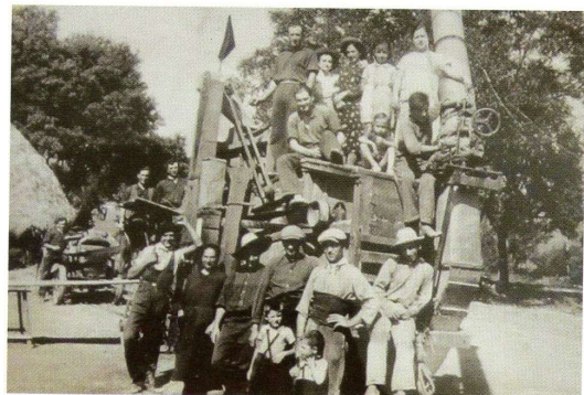
Màquina de batre amb tota la família i amics.

El meu pare es va comprar, de segona mà, un tractor Bulldog Lanz que tenia un tub d'escapament estil xemeneia en un lateral, feia un fum impressionant que a més l'havies de respirar. També es va comprar una màquina de batre.