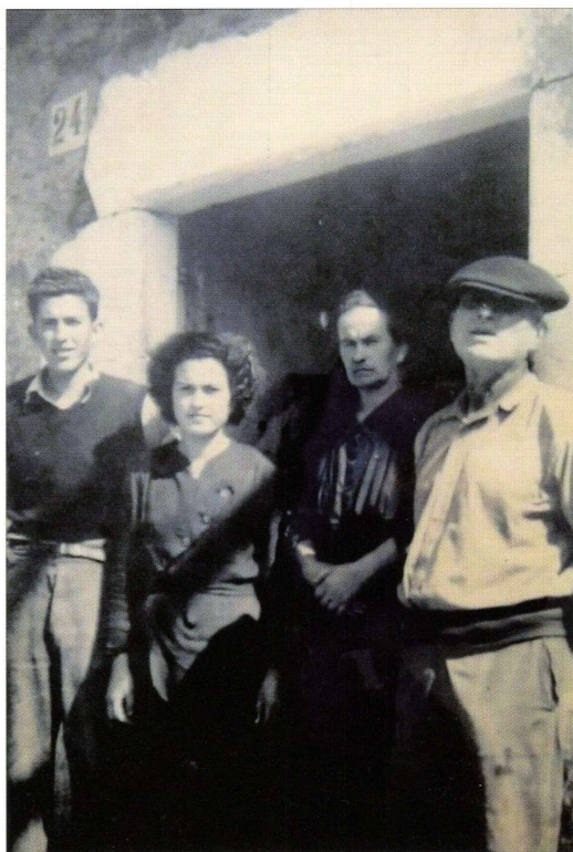
A la porta de can Boxiner amb els meus pares, meva germana i jo